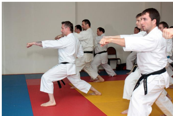
Академия будо для взрослых