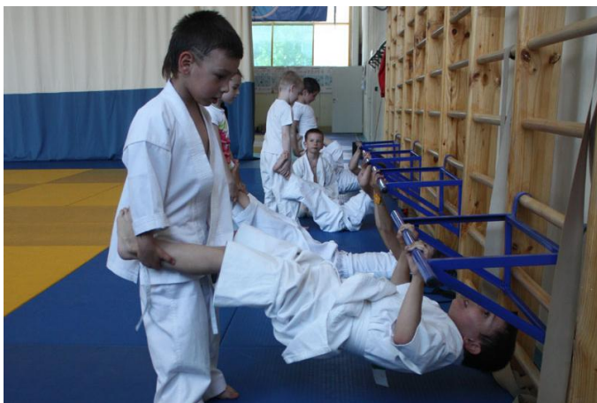
Школа будо для детей